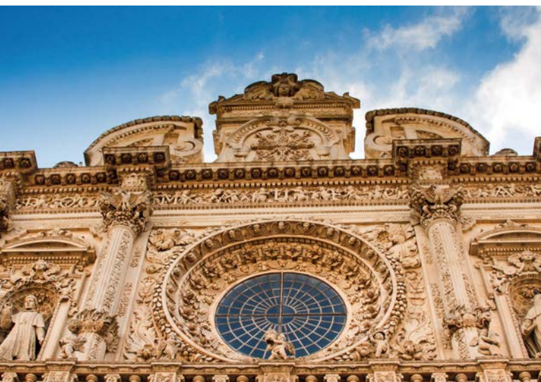
Sotto, la Basilica di Santa Croce a Lecce